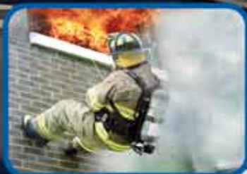
LUCHA CONTRA INCENDIOS