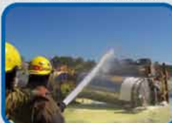
SIMULACROS EN EL TRANSPORTE DE MERCANCIAS POR CARRETERA