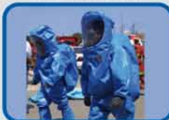
MATERIALES PELIGROSOS I MATERIALES PELIGROSOS II