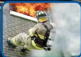
LUCHA CONTRA INCENDIOS