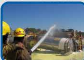
SIMULACROS EN EL TRANSPORTE DE MERCANCIAS POR CARRETERA