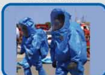
MATERIALES PELIGROSOS I MATERIALES PELIGROSOS II