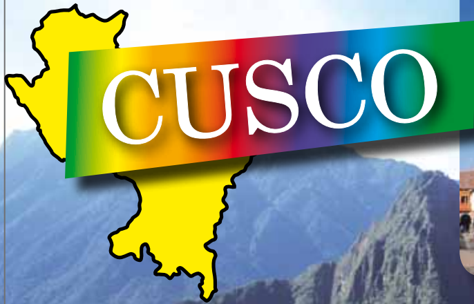
Plaza de Armas de Cusco.