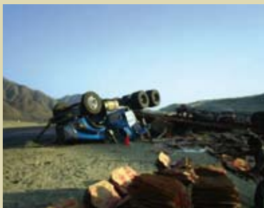
Conducción a la defensiva