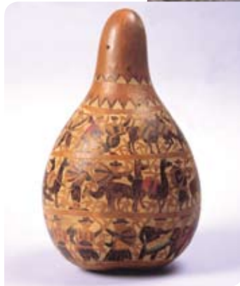
Mate Butilado de Cochas