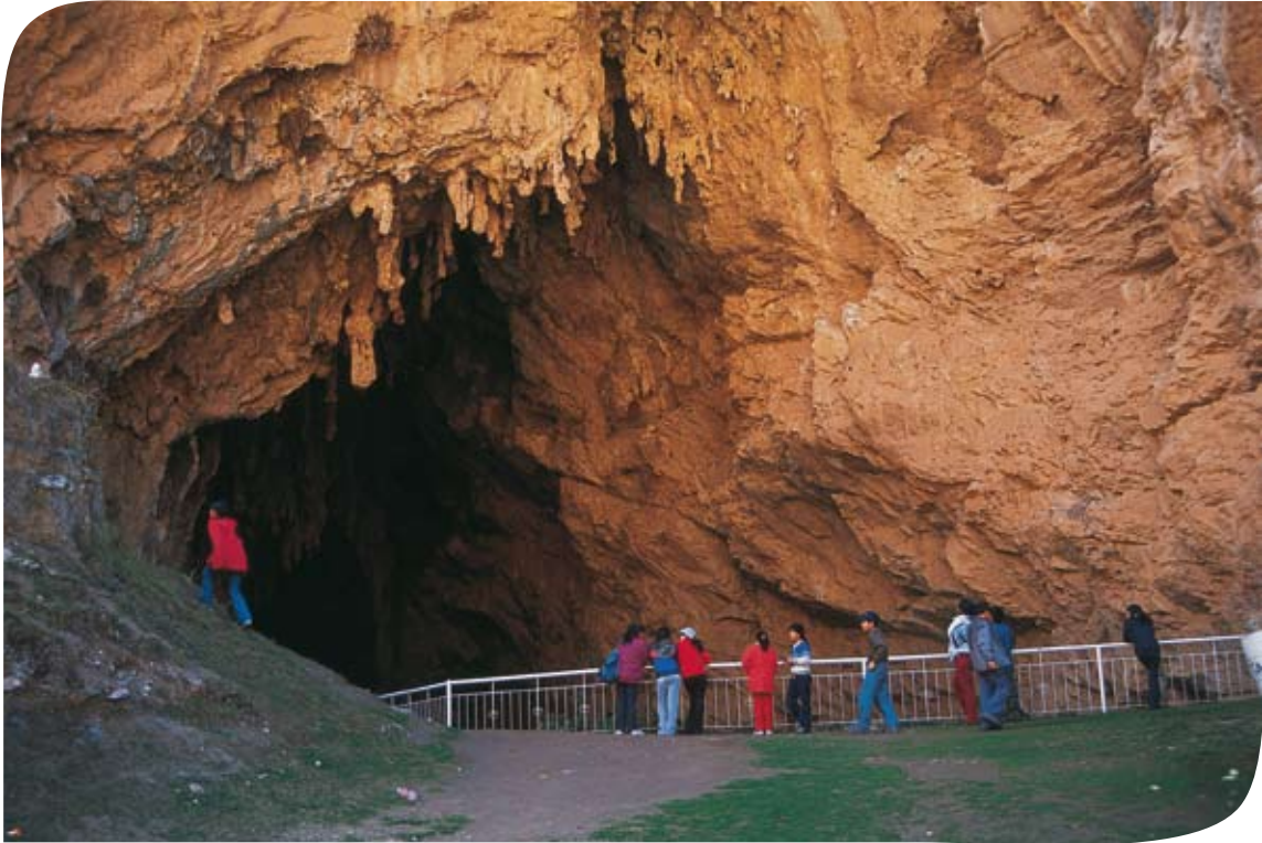
Gruta de Huagapo - Tarma.

E l departamento de Junín junto con el de Pasco forma la región andina central del territorio peruano. Las Cordilleras Occidental y Central atraviesan su territorio. Abarca tanto zonas de sierra como de selva amazónica. Por el oeste, en el límite con Lima, la cordillera presenta cumbres escarpadas cubiertas de nieve. El paisaje se prolonga hacia el este con valles glaciares y mesetas de gran altitud. En la ceja de selva abundan los cañones estrechos y profundos y los bosques de neblina.