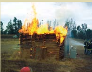
Lucha contra incendio