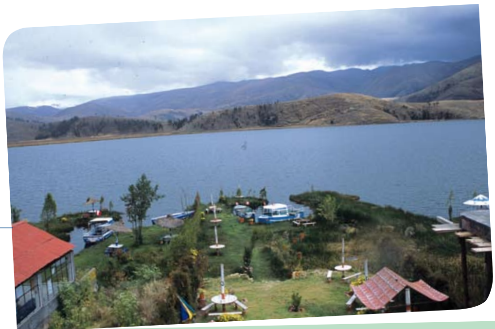
Laguna de Paca.