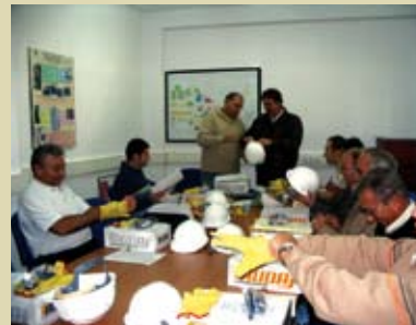
Gestión de la seguridad y salud en el trabajo conforme al D.S. 009-2005-TR y su modificatoria D.S. 007-2007-TR