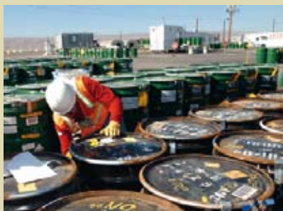
Materiales Peligrosos (MATPEL) Nivel I y Nivel II