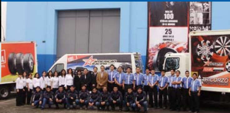
Personal de Tricorzo en el frente de su local.

- ¿Qué cargo desempeña y qué nos puede comentar sobre la trayectoria de Tricorzo?