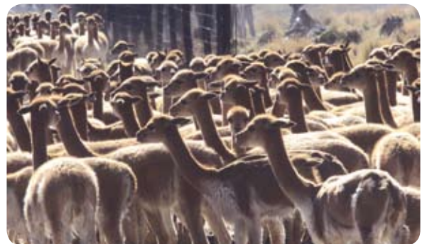
La vicuña está presente en Ayacucho.

- Pueblo de Quinua. A 32 km., al noroeste de la ciudad de Ayacucho. Quinua (3396 msnm) conserva el espíritu de los típicos poblados andinos y sus habitantes se dedican mayormente a la cerámica. En este lugar se firmó la Capitulación de Ayacucho, que puso fin al dominio español. Existe en la plaza principal un museo de sitio y la piedra donde se firmó el Acta de Capitulación.