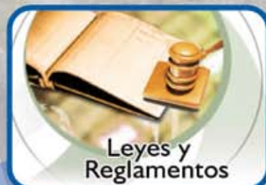
Leyes y Reglamentos

REGLAMENTO NACIONAL DE TRÁNSITO D.S. N° 016-2009-MTC Y MODIFICATORIAS REGLAMENTO NACIONAL DE ADMINISTRACIÓN DE TRANSPORTE D.S. N° 017-2009-MTC Y MODIFICATORIAS