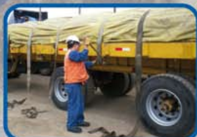
ESTIBA Y TRINCA