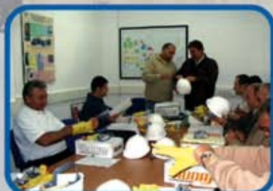
GESTIÓN DE SEGURIDAD Y SALUD EN EL TRABAJO