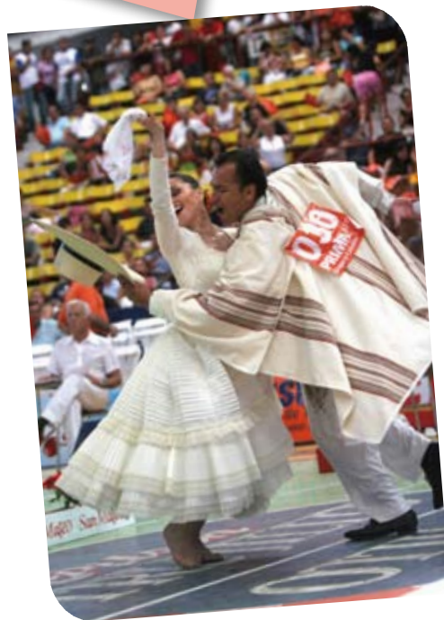
Marinera Norteña en Trujillo.

La Libertad es una de las regiones más ricas en lo que se refiere a