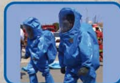
MATERIALES PELIGROSOS I MATERIALES PELIGROSOS II