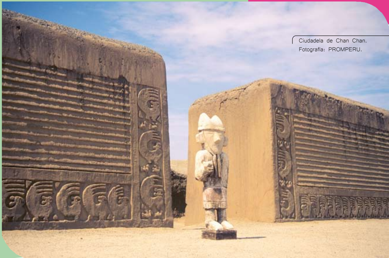
Ciudadela de Chan Chan.

herencia arqueológica, sus manifestaciones artísticas expresadas en cerámica, orfebrería y decoración mural policromada.