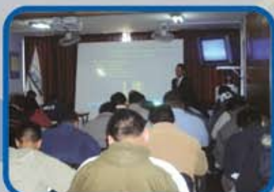
PLAN DE CONTINGENCIA