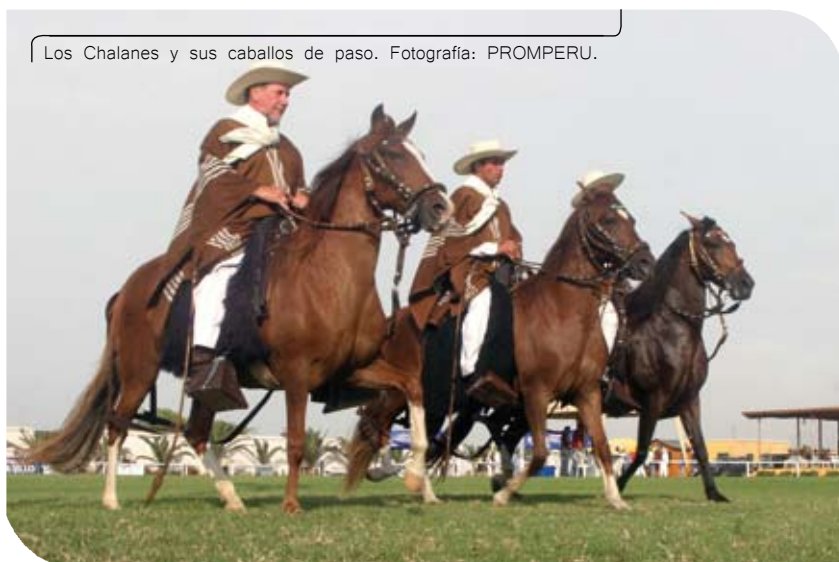
Los Chalanés y sus caballos de paso.

Por otra parte, en la costa tenemos a Huanchaco, célebre por sus caballitos de totora, Salaverry, Malabrigo. Este balneario se encuentra aproximadamente a 13 km de la ciudad de Trujillo, a unos 15 minutos en auto. Cuenta la leyenda que hace unos 800 años atrás desembarco en Huanchaco el Príncipe Tacaynamo con su séquito, fundando de esta manera la primera dinastía Chimú. En sus aguas aún navegan los "caballitos de totora", que son balsas tradicionales usadas por los pescadores de la costa norte peruana.