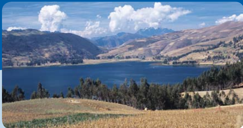
Laguna de Pacucha. Fotografía: PROMPERÚ.

La población desciende de la legendaria cultura Chanca que se desarrolló en Apurímac, sobre todo en la actual provincia de Andahuaylas, y se dedican principalmente a la agricultura. La zona fue motivo de sangrientos enfrentamientos entre dos pueblos enemigos, los chancas y los incas.