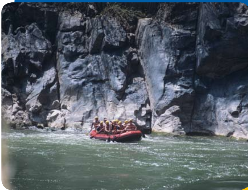
Canotaje en el río Apurímac.

El 28 de abril de 1873 se creó el departamento de Apurímac con Abancay como capital. Sin embargo, la ciudad de Andahuaylas también tiene mucho movimiento comercial, estableciéndose como un contrapeso en la importancia que tienen dentro del departamento. Y es en esta ciudad donde nació el ilustre escritor y antropólogo José María Arguedas, quien volcó en sus obras los dos mundos en que vivió: el andino y el occidental. Asimismo, la famosa compositora criolla creadora de “la flor de la canela” Chabuca Granda nació en el distrito de Progreso, provincia de Grau.