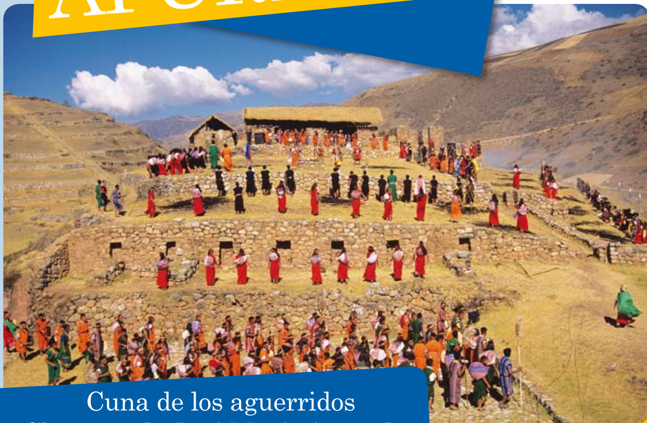
Sondor Raymi