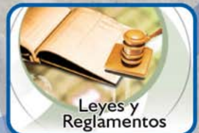
Leyes y Reglamentos

REGLAMENTO NACIONAL DE TRÁNSITO D.S. N° 016-2009-MTC Y MODIFICATORIAS REGLAMENTO NACIONAL DE ADMINISTRACIÓN DE TRANSPORTE D.S. N° 017-2009-MTC Y MODIFICATORIAS