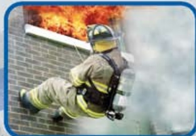
LUCHA CONTRA INCENDIOS