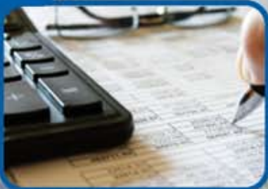
COSTOS DE TARIFAS