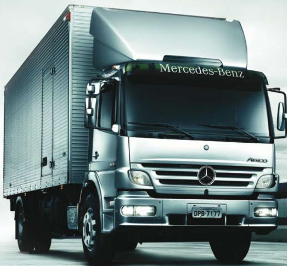
Foto referencial. Mercedes-Benz, una marca Daimler