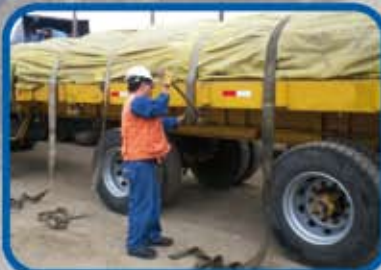
ESTIBA Y TRINCA