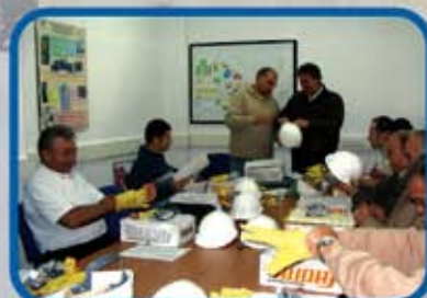
GESTIÓN DE SEGURIDAD Y SALUD EN EL TRABAJO