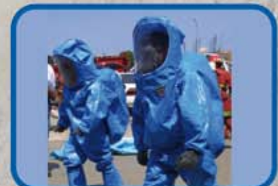
MATERIALES PELIGROSOS I MATERIALES PELIGROSOS II