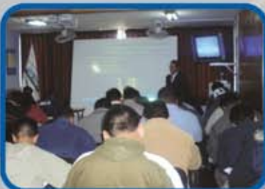
PLAN DE CONTINGENCIA